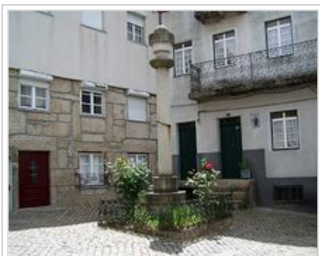
Largo do Pelourinho

Loriga tinha a categoria de sede de concelho desde o século XII, tendo recebido forais em 1136 (João Rhânia, senhorio das Terras de Loriga durante cerca de duas décadas, no reinado de D.Afonso Henriques), 1249 (D.Afonso III), 1474 (D.Afonso V) e 1514 (D.Manuel I). Apoiou os Absolutistas contra os Liberais na guerra civil portuguesa. Deixou de ser sede de concelho em 1855 após a aplicação do plano de ordenação territorial levada a cabo durante o século XIX, curiosamente o mesmo plano que deu origem aos Distritos. Porém, partir da segunda metade do século XIX tornou-se um dos principais pólos industriais da Beira Interior, com a implantação da indústria dos lanifícios, que entrou em