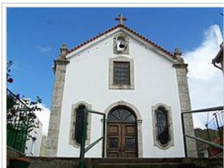
Capela de Nossa Senhora do Carmo

A estrada romana e uma das duas pontes (a outra ruiu no século XVI após uma grande cheia na Ribeira de S. Bento), com as quais os romanos ligaram Loriga, na Lusitânia, ao restante império, merecem destaque.