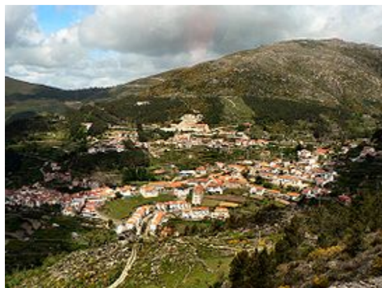
Vista geral de Loriga