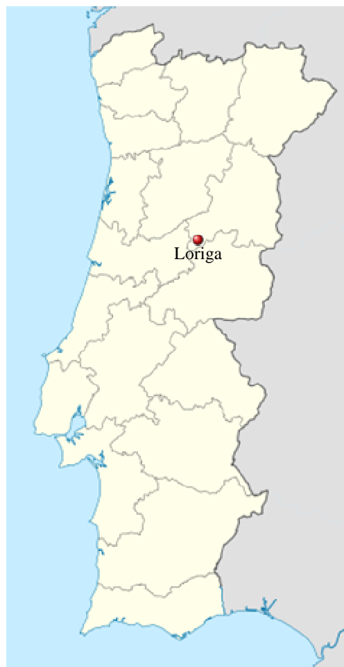
Localização de Loriga em Portugal