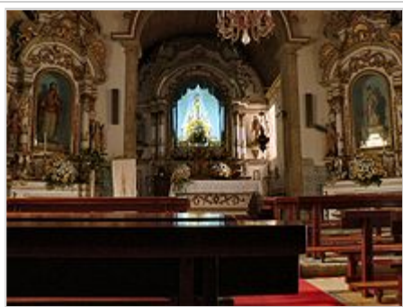
Igreja Matriz de Loriga - vista interior

O nome veio da localização estratégica da povoação, do seu protagonismo e dos seus habitantes nos montes Hermínios (actual Serra da Estrela) na resistência lusitana, o que levou os romanos a porem-lhe o nome de Loriga , designação geral para couraça guerreira romana; deste nome derivou Loriga (derivação iniciada pelos Visigodos), e que tem o mesmo significado.