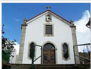
Capela de Nossa Senhora do Carmo.

A estrada romana e uma das duas pontes (a outra ruiu no século XVI após uma grande cheia na Ribeira de S. Bento), com as quais os romanos ligaram Loriga, na Lusitânia, ao restante império, merecem destaque.