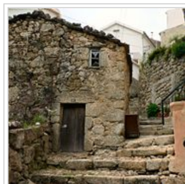
Rua da Oliveira.

O bairro de São Ginês é um bairro do centro histórico de Loriga cujas características o tornam num dos bairros mais típicos da vila. As melhores festas de São João eram feitas aqui. Curioso é o facto de este bairro dever o nome a São Gens, um santo de origem céltica matirizado em Arles, na Gália, no tempo do imperador Diocleciano, orago de uma ermida visigótica situada na área. Com o passar dos séculos os loriguenses mudaram o nome do santo para S. Ginês, talvez por ser mais fácil de pronunciar, e finalmente abandonaram o culto e mudaram o orago da sua ermida para Nossa Senhora do