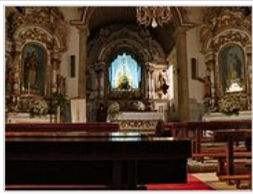
Igreja Matriz de Loriga - vista interior.

O nome veio da localização estratégica da povoação, do seu protagonismo e dos seus habitantes nos montes Hermínios (actual Serra da Estrela) na resistência lusitana, o que levou os romanos a porem-lhe o nome de Lorica , designação geral para couraça guerreira romana; deste nome derivou Loriga (derivação iniciada pelos Visigodos), que tem o mesmo significado.