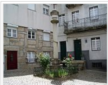
Largo do Pelourinho.