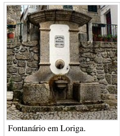
Fontanário em Loriga.

O sismo de 1755 provocou enormes estragos na vila, tendo arruinado também a residência paroquial e aberto algumas fendas nas robustas e espessas paredes do edifício da Câmara Municipal construído no século XIII. Um emissário do Marquês de Pombal esteve em Loriga a avaliar os estragos mas, ao contrário do que aconteceu com a Covilhã (outra localidade serrana muito afectada), não chegou do governo de Lisboa qualquer auxílio.