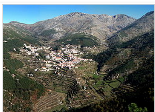
Vista panorâmica de Loriga e do vale glacial com o mesmo nome, semelhante a uma paisagem alpina.

Loriga, situada na parte sudoeste da Serra da Estrela, encontra-se a 20 km de Seia, 80 km da Guarda e 320 km de Lisboa. A vila é acessível pela EN 231 e pela EN338, estrada concluída em 2006 com mais de quarenta anos de atraso, seguindo um traçado pré-existente, com um percurso de 9,2 km de paisagens de montanha, entre as cotas 960m (Portela do Arão) e 1650m, junto à Lagoa Comprida.